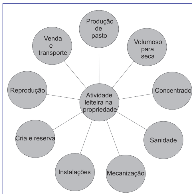
Figura 1 Atividades relacionadas com a produção leiteira

A inovação tecnológica e a gestão rural no processo da globalização tornaram-se procedimentos significativos e importantes para o aumento da competitividade entre empresas nacionais e multinacionais. No cenário internacional, a competição efetivada por intermédio das multinacionais acabou por impulsionar os fluxos de bens, serviços e conhecimentos que passaram as fronteiras nacionais, incrementando as relações comerciais e a difusão de inovações tecnológicas, aumentando, dessa forma, o poder econômico das empresas dos países integrantes da Organização para a Cooperação e Desenvolvimento Econômico (OCDE).