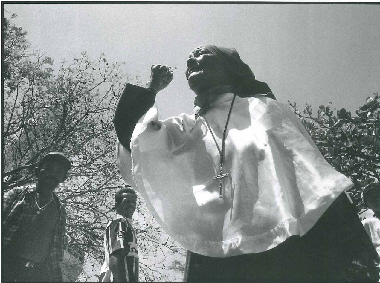
ROMARIA DO PADRE CÍCERO. JUAZEIRO DO NORTE, CEARÁ

Acredita-se que as mulheres são geralmente muito calmas: mas elas sentem exatamente como os homens sentem; elas precisam de exercícios para suas faculdades e de um campo para seus esforços assim como seus irmãos homens precisam; elas sofrem uma limitação tão rígida, como também uma estagnação tão grande, exatamente como o homem poderia sofrer; e seria uma perspectiva muito pequena acerca de suas companheiras mais privilegiadas dizer que elas deveriam ficar confinadas a cozinhar e fazer rendas, a tocar piano e bordar bolsas.