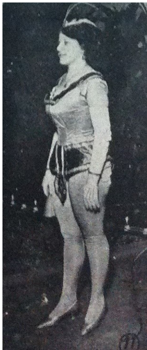
Figura 2 – High Life Club.