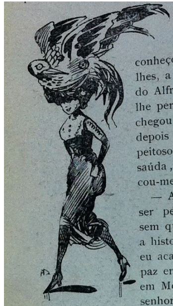
Figura 1 – “Carnet de uma mundana”.

gentrificado 16 pelos objetivos e usos que essa forma de representação exerceu em seu tempo. Isto é, a imprensa de gênero alegre criou e celebrou um tipo de feminino que é chamado nesse estudo de gentrificado por edificar o corpo da mulher do desejo como “signo” e “símbolo” da modernização do país, numa relação em que espaço e gênero se instituem instituindo um ao outro simultaneamente 17 , proporcionando a materialização do imaginário da Belle Époque imoral. Nessas potências pornô-eróticas: