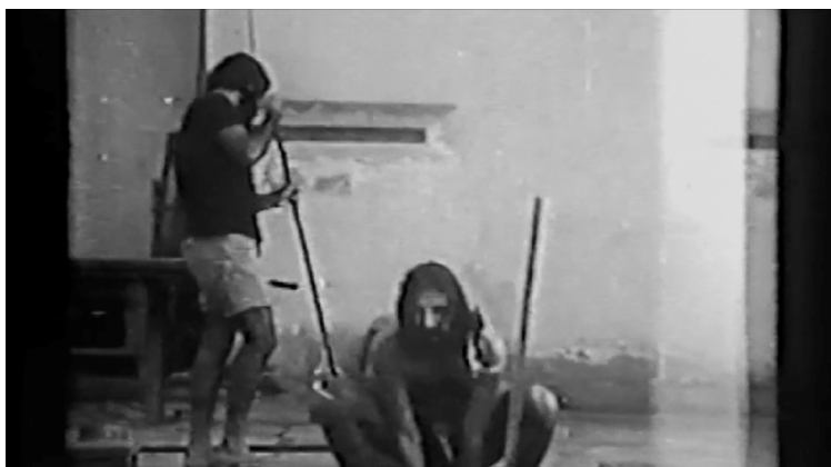
Figura 2 – Imagens realizadas no Presídio Frei Caneca no período da greve de fome de presos políticos e retomadas em Fico te devendo uma carta sobre o Brasil .

no filme que revela as origens desse material informa: “Imagens realizadas por um prisioneiro político no mesmo presídio para o qual César foi transferido” (Figura 2).